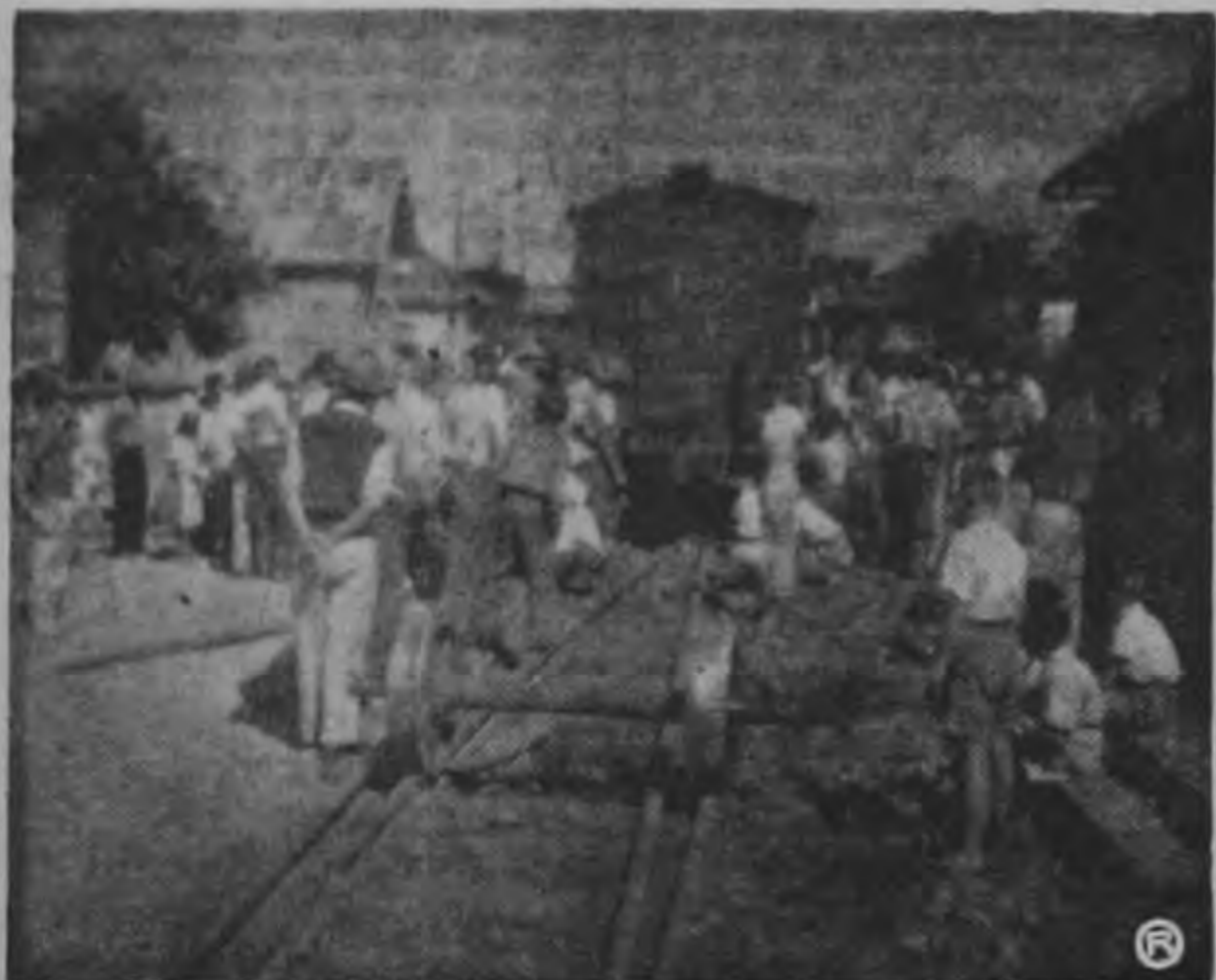
CARRO DESCARRILADO —El carro 1209 de la extra oeste 32-33 que descarriló ayer a las cinco y treinta de la mañana en el centro de Cartago. A pesar de lo aparatoso del accidente, no se registraron desgracias ni entre el personal del tren, ni en perjuicio de la vía.