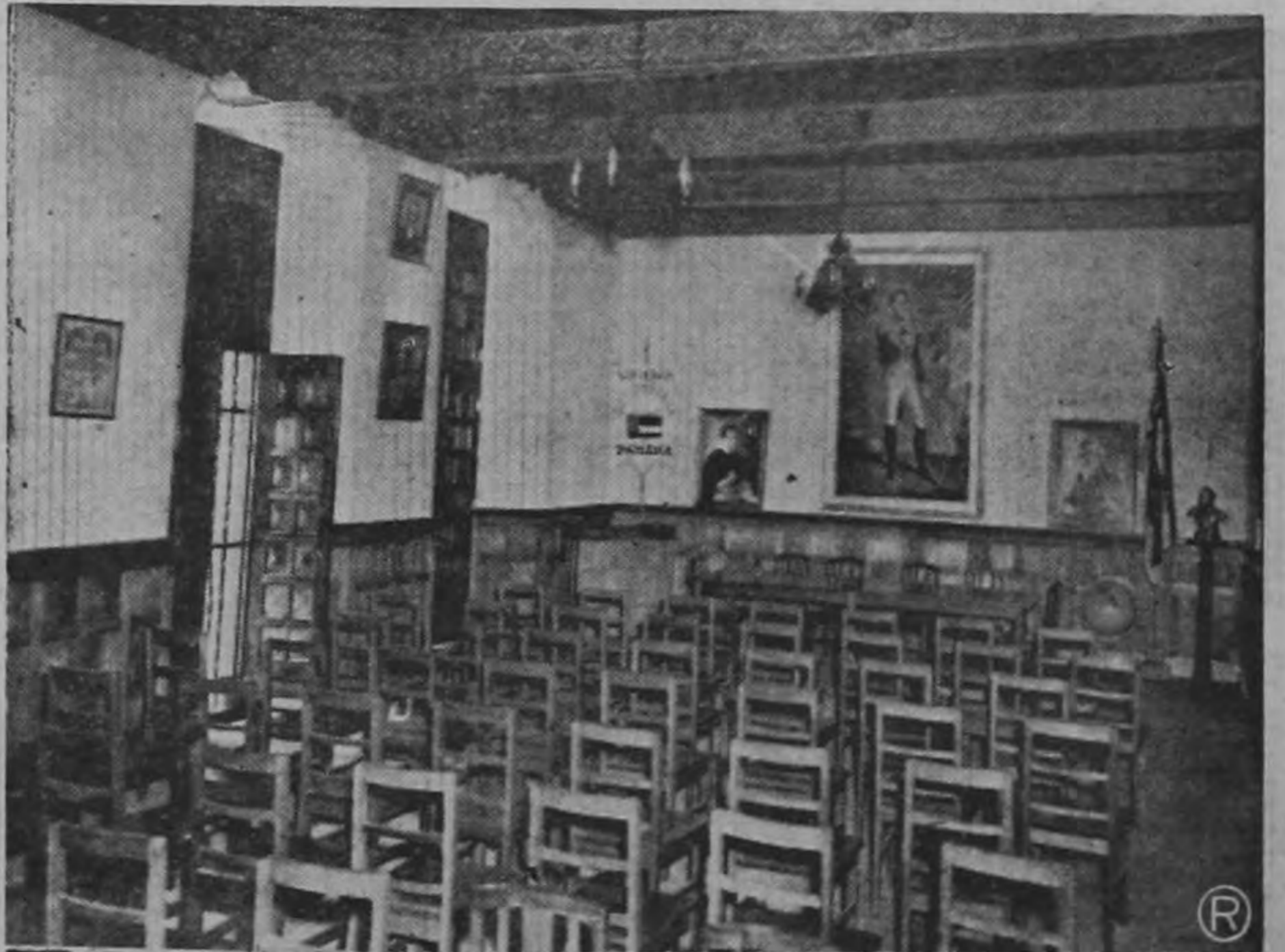
La Sala Capitular del Convento de San Francisco, en donde hace 130 años, también se reunieron los Jefes de Estado de América por convocatoria de Bolívar.