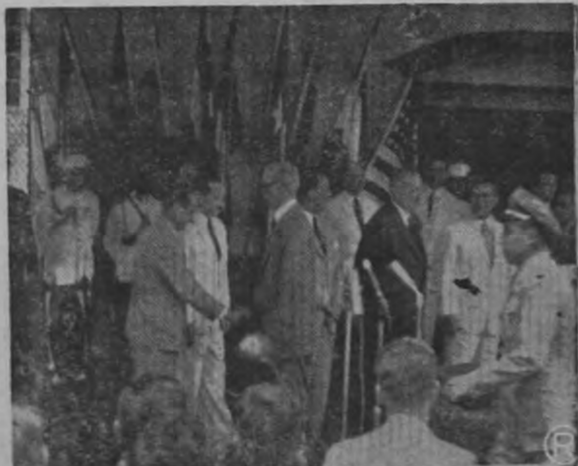
Los Presidentes Figueres y Velasco Ibarra, de Costa Rica y Ecuador, se dan las manos.