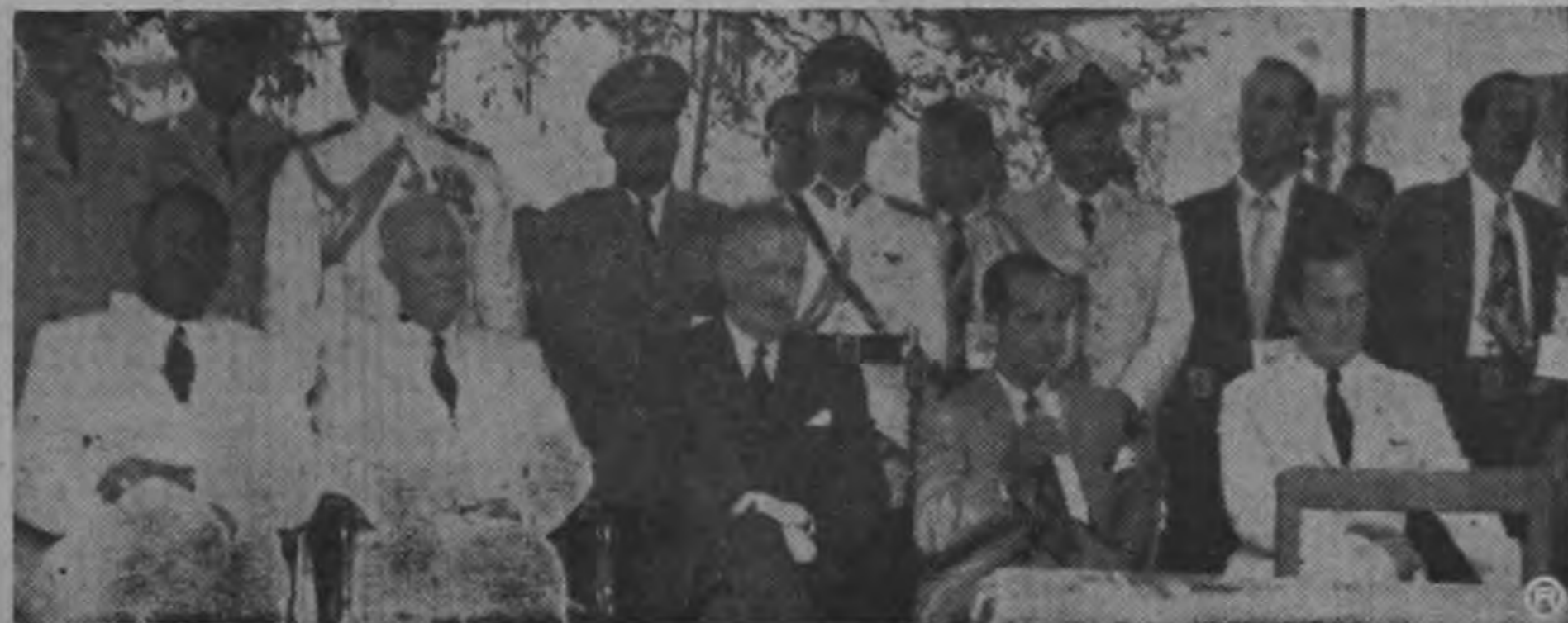
1) Aparecen departiendo en un acto de la histórica reunión de Presidentes de derecha a izquierda: Aramburu, Figueres, Ibañez del Campo, Eisenhower y Magloire. Al fondo algunos de los edecanos. — Costa Rica se distinguió por no tener militares en ninguno de los actos. El hecho fue comentado muy vivamente en la ciudad de Panamá.

Dice el Gerente de la Caja del Seguro Social, contestando publicaciones del Secretario de la Junta Progresista LA UNION — TEXTO EN PAGINA 22 —