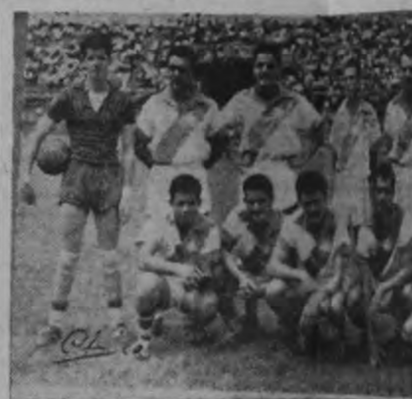
El cuadro recluta sigue en la mala racha y ocupa lugar de la clasificación seriamente amenazado de el próximo campeonato. El domingo sus hombres, mucho empeño y le hicieron tenaz resistencia a la la que vinieron dos fallos de su defensa en el segundo ocasionaron su derrota.