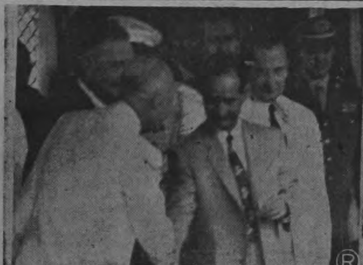
2) Los Presidentes Figueres y Eisenhower, se dan las manos en el momento de entrar al recinto en donde se firmaría la histórica Declaración de Panamá, que damos a conocer en la completa información que hoy da LA REPUBLICA a sus lectores.

Al desterrar a esos hondureños por el solo hecho de oponerse a la política de su gobierno Ud. está privándoles del ejercicio de los derechos de libre expresión de la palabra y del pensamiento; de reunión, de moverse libremente dentro y fuera de su país y de actuar en los asuntos políticos de su patria sin peligro de expulsión. Esa acción de Su Excelencia es de lamentar, ya que, como signatario de la Declaración Universal de los Derechos Humanos de las Naciones Unidas, el gobierno de Honduras se obligó moralmente al respeto de aquellos derechos humanos estipulados en ese documento internacional