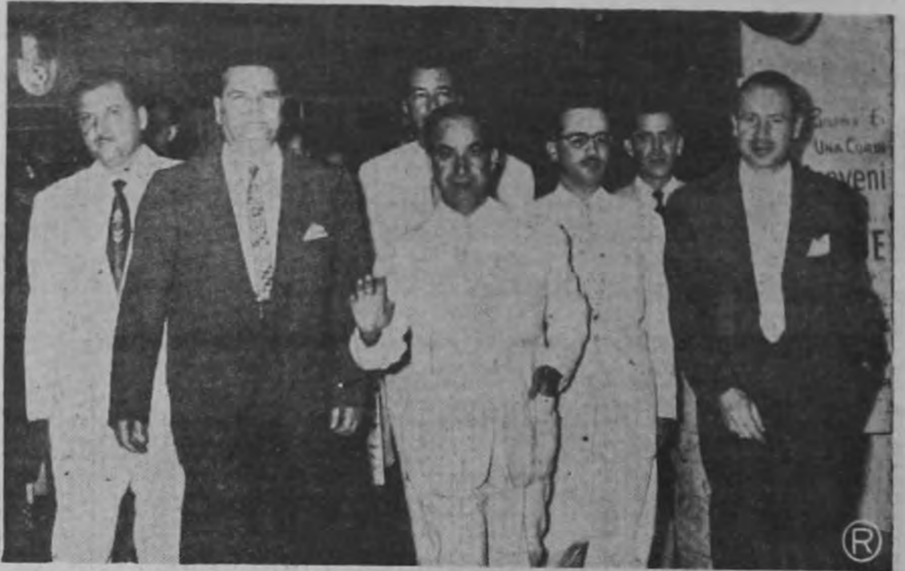
—Presidente Figueres y su comitiva en el momento de salir del Hotel El Panamá para la firma de la Declaración que lleva el nombre del país Sede de la Histórica Conferencia.

El Servicio Meteorológico del Ministerio de Agricultura ha anunciado que a partir de la fecha suspenderá el servicio de dar la hora por teléfono, que ha sido costumbre suministrar al público y a instituciones. Al dar el aviso, el Servicio ha informado que será por el tiempo que tarde la llegada al país de un moderno juego de cronómetros que adquirió el Ministerio para diversos fines. Estos aparatos son de alta precisión y garantizan absoluta corrección en la marca del tiempo.