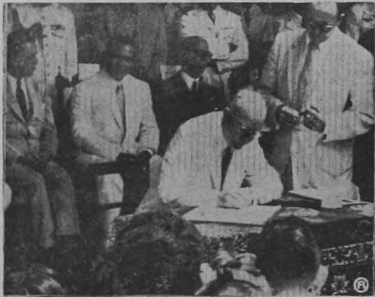
Eisenhower firma la Declaración de Panamá.