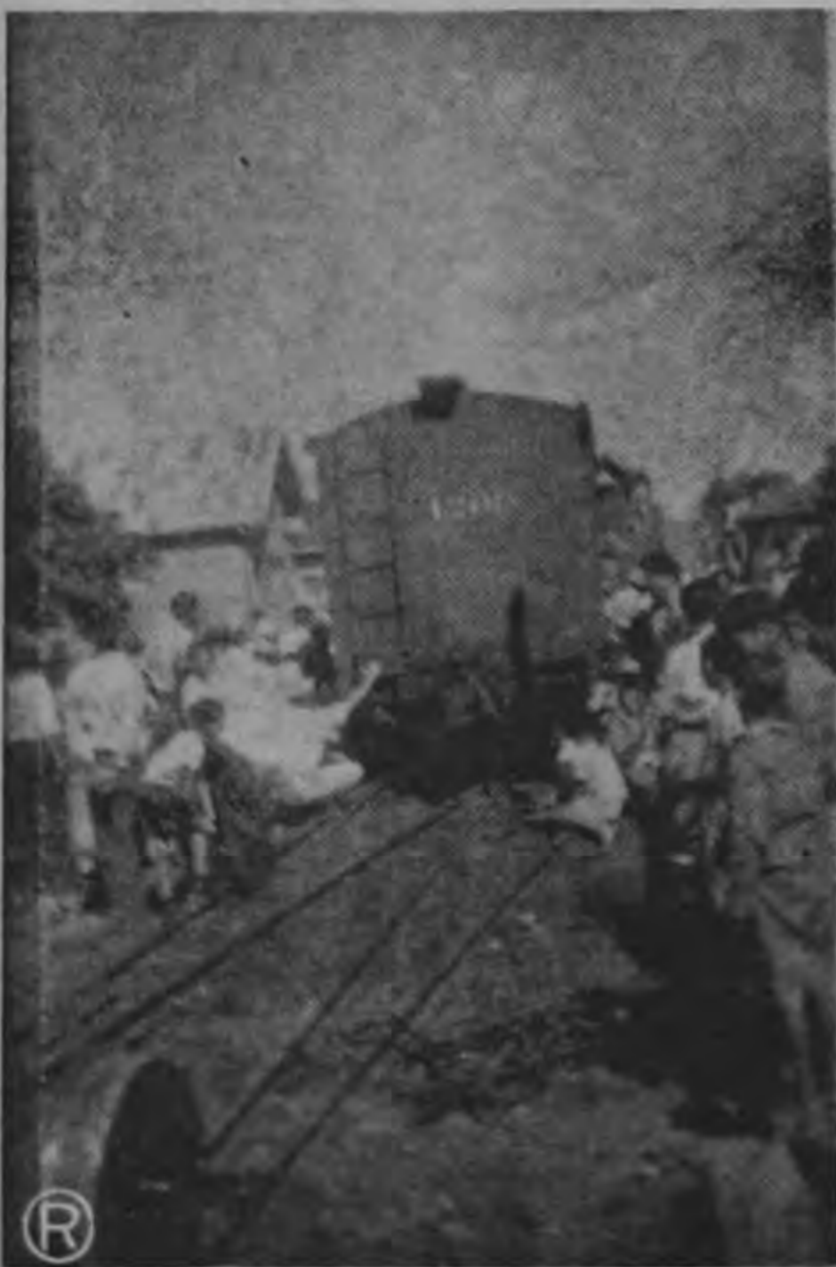
ACELERAN LA LABOR —Las cuadrillas de la Northern que fueron enviadas al descarrillamiento ocurrido ayer a las cinco y treinta de la mañana en Cartago, apresuran los trabajos para expedir la vía. En ambos sentidos habían varios trenes embotellados.