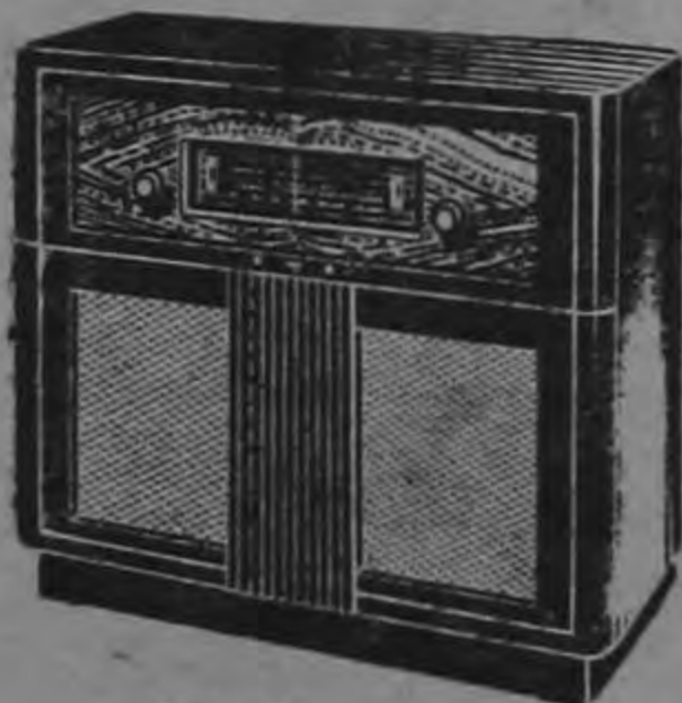
F X 637 A