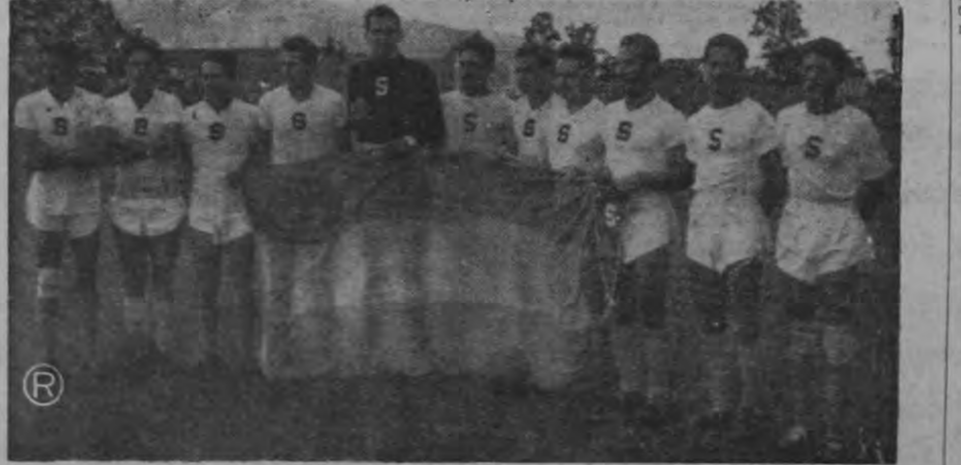
Los morados sostuvieron el domingo un partido amistoso frente a los florenses, ante numerosa concurrencia en el Estadio herediano, que terminó con división de honores a dos goles por bando. Pese a que los dos equipos se presentaron bastante parchados, el futbol ofrecido a los espectadores fue bastante atractivo, pues se jugó con ganas sin llegar a las brusquedades. Los sapriistas estuvieron dos veces en ventaja en el marcador pero sus rivales lograron empatar el marcador en ambas ocasiones. Lástima grande que la ausencia de valores grandes de ambos conjuntos le restara la brillantez que siempre ha caracterizado este clásico del fútbol costarricense.