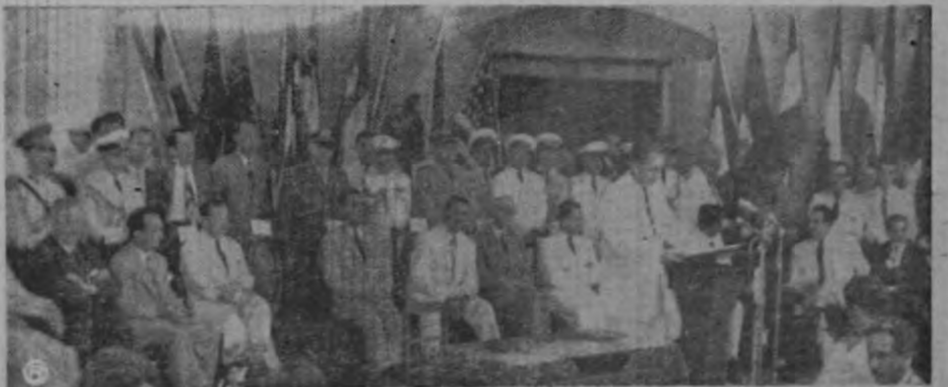
—Presidente Arias de Panamá, en el instante en que dirigía la palabra para hacer el saludo a los 19 Jefes de Estado que se dieron cita para el conclave histórico.