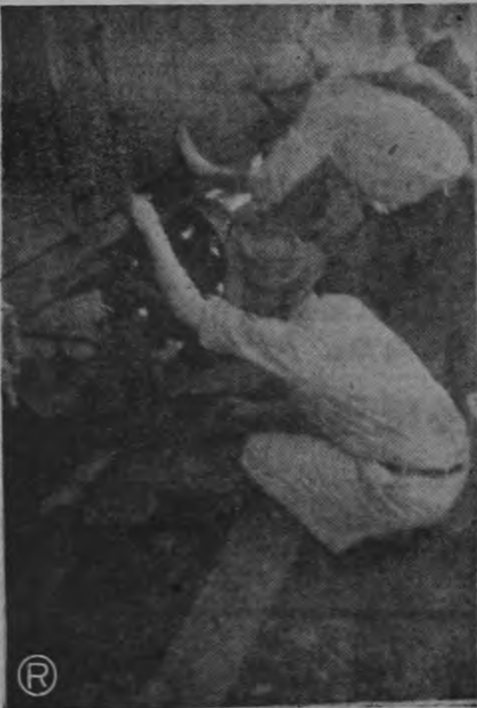
REPARANDO LOS DAÑOS —La gráfica muestra cuando el personal de mantenimiento de la Northern Railway Co. trataba de reparar el carro afectado seriamente al ser arrastrado casi 500 metros fuera de los rieles, dañándose considerablemente y causando destrozos en la vía